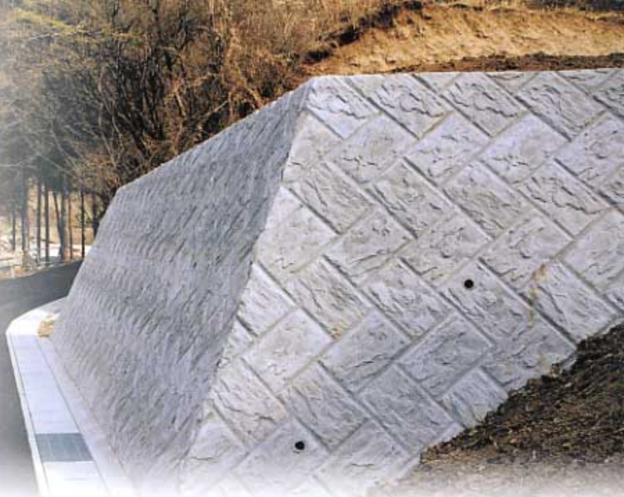
通常(荒廃)砂防事業 工事用道路工 吾妻川支川 かばら沢 長野原町横壁