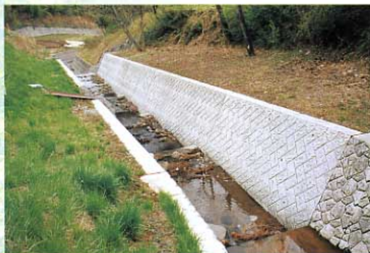
不動沢 砂防施設事業 吾妻町原町