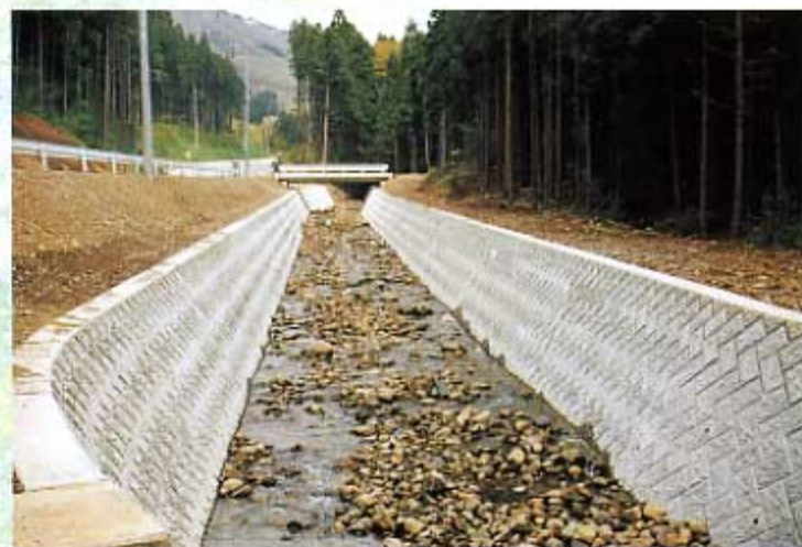
主要地方道 渋川新治線 道路改築(改良)事業 高山村中山