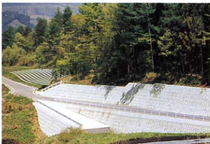
県営ふるさと農道緊急整備事業 上袋倉地区農道4号 嬭恋村袋倉