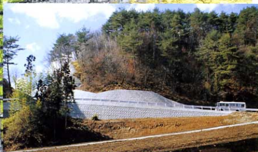
六合村道 赤岩日影線