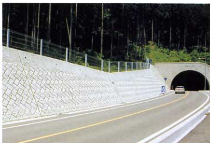
国道353号線 湯原トンネル入口 中之条町四万