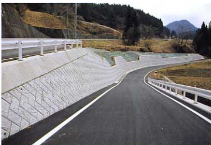
(吾)東村道2054線 (吾)東村奥田