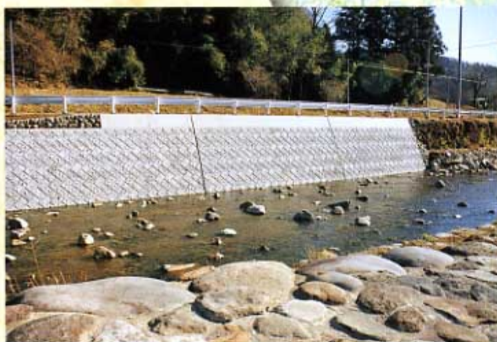
平成11年度災害復旧事業 名久田川 高山村尻高