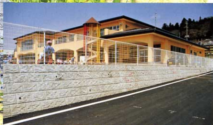
中之条町立伊勢町保育所