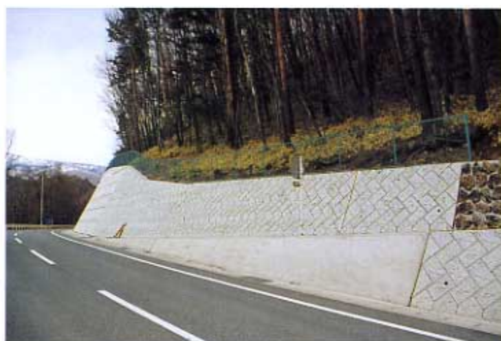
国営農地開発事業 嬭恋幹線道路 嬭恋村千俣