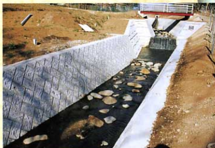
温湯川 砂防施設事業 中之条町大塚